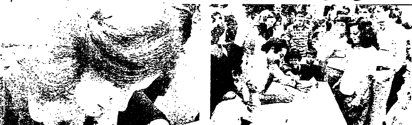
مواطنون يشطبون المذهب عن هوياتهم

بيروت 2 - يومين من المظاهرات والاعتصام في بيروت ضد العنف، و600 مواطن يشطبون المذهب عن هوياتهم، في مسيرات واطلاق نار في مختلف المناطق اللبنانية. في مسيرات واطلاق نار في مختلف المناطق اللبنانية، و600 مواطن يشطبون المذهب عن هوياتهم، في مسيرات واطلاق نار في مختلف المناطق اللبنانية.